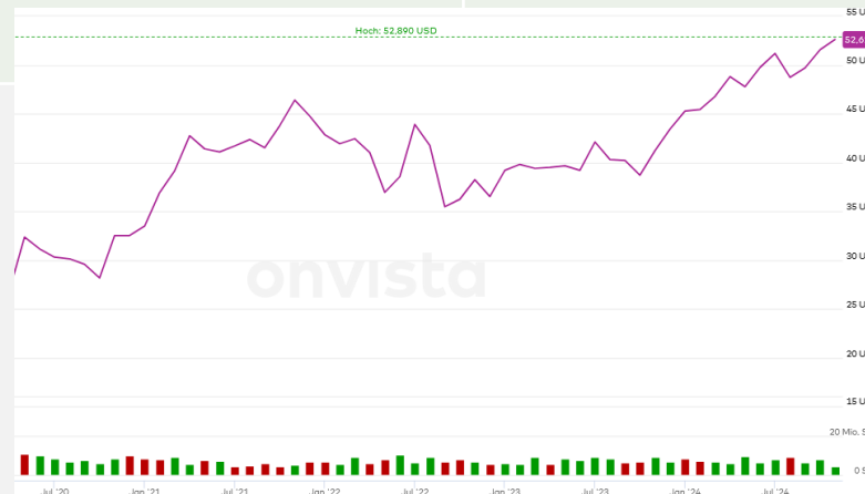
Langfristig aufwärtsgerichteter Chart